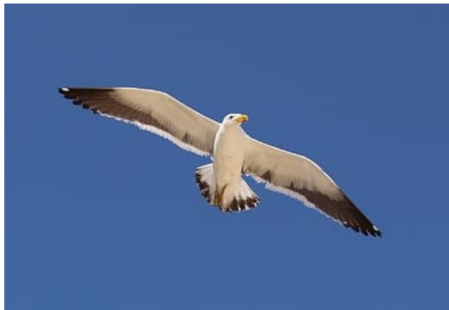
Figura 4. Gaviota dominicana o cocinera, Larus dominicanus .

Ante la abundante población de gaviotas, se solicitó la asesoría especializada independiente de un ornitólogo de la Universidad de Chile y asesor externo del CEFAA, quien determinó que lo que se consideró como un fenómeno aéreo anómalo en la fotografía era una gaviota dominicana o cocinera, Larus dominicanus , en vuelo.