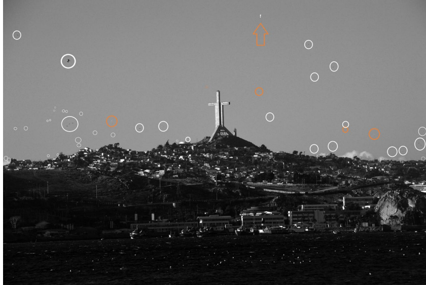
Figura 3. Aves en vuelo y fenómeno reportado (flecha naranja)

Dado que la velocidad de obturación fue de 1/640 segundos y el enfoque estaba en automático, se levantó la hipótesis de estar frente a un ave de cuerpo blanco, captada fortuitamente al girar y que se interpretó como un objeto levitando en posición vertical.