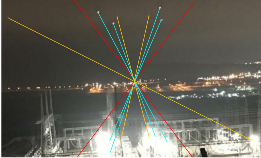
Figura 4. Objetos reportados de la imagen 1305-4.

Imágenes: El usuario aportó cuatro imágenes en archivos de tipo jpg, renombradas siguiendo el siguiente esquema: