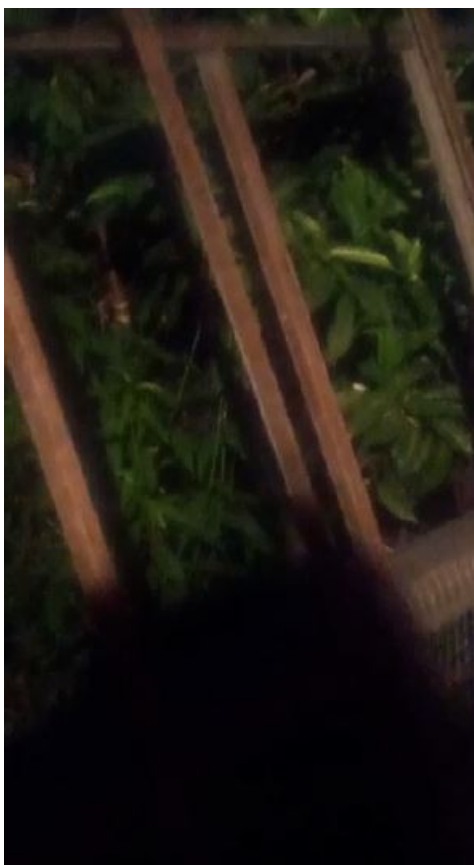
Fotograma 2 del Video I en el track 21 segundos y 6 centésimas.

Se observa la sombra de quien filmó el video proyectada sobre una especie de división de madera tras la cual se ven las hojas de varias plantas.