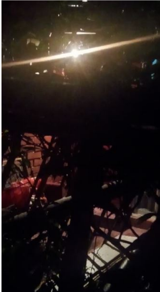
Fotograma 1 del Video II en el track 52 segundos y 20 centésimas. Se observan hojas de plantas en un patio interior a contraluz y en el fondo una pared de ladrillos, tipo princesa, iluminada.