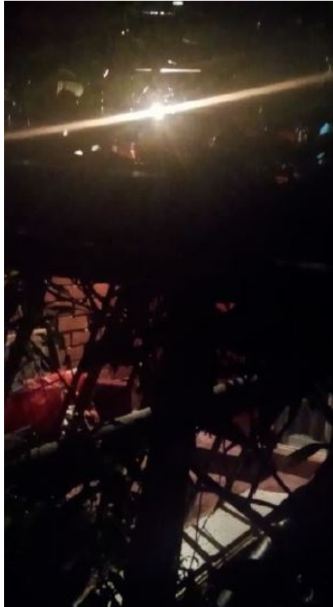
Fotograma 1 del Video III en el track 18 segundos y 17 centésimas. Se observa una fuente de luz interior y en primer plano hojas de vegetación y maderos cruzados con un fondo de muralla de ladrillo tipo princesa y un mueble de color rojo iluminado.