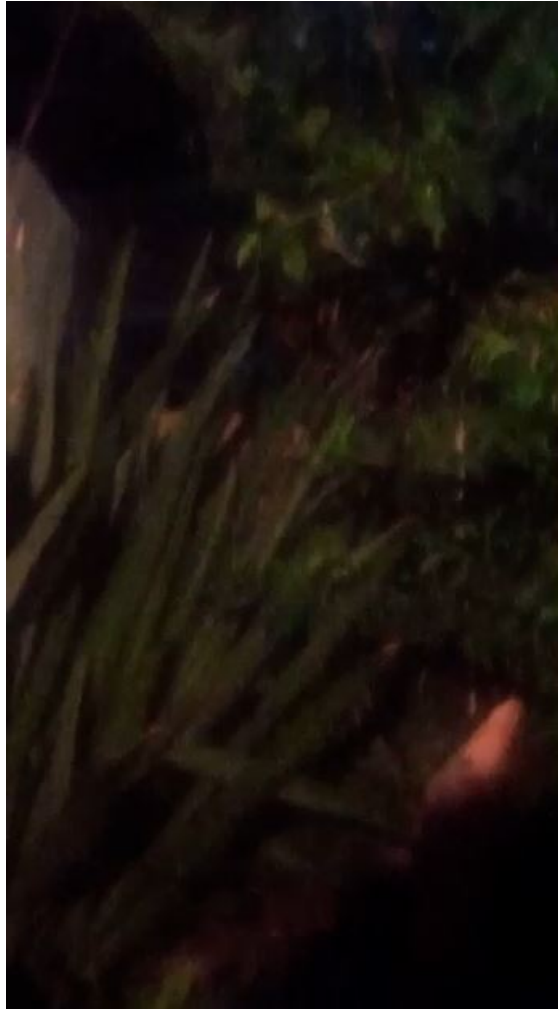
Fotograma 1 del Video I en el track de 17 segundos y 16 centésimas.

Se observa una imagen muy oscura de poco contraste en la que se ve parte de las hojas de una planta alumbrada por una luz muy tenue.