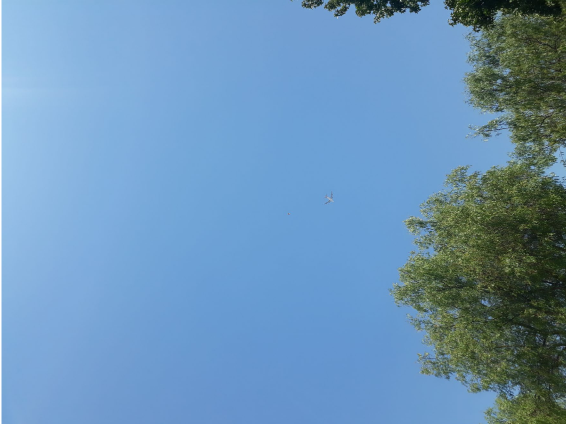
Figura 1. Fotografía que originó el caso. El cuadro negro contiene al fenómeno reportado.

Se georreferenció la ubicación del fotógrafo, que correspondió a un parque al interior de la Ciudad Satélite de Maipú, en las coordenadas 33^{\circ} 33' 33'' S y 70^{\circ} 47' 20'' W. (Figura 2)